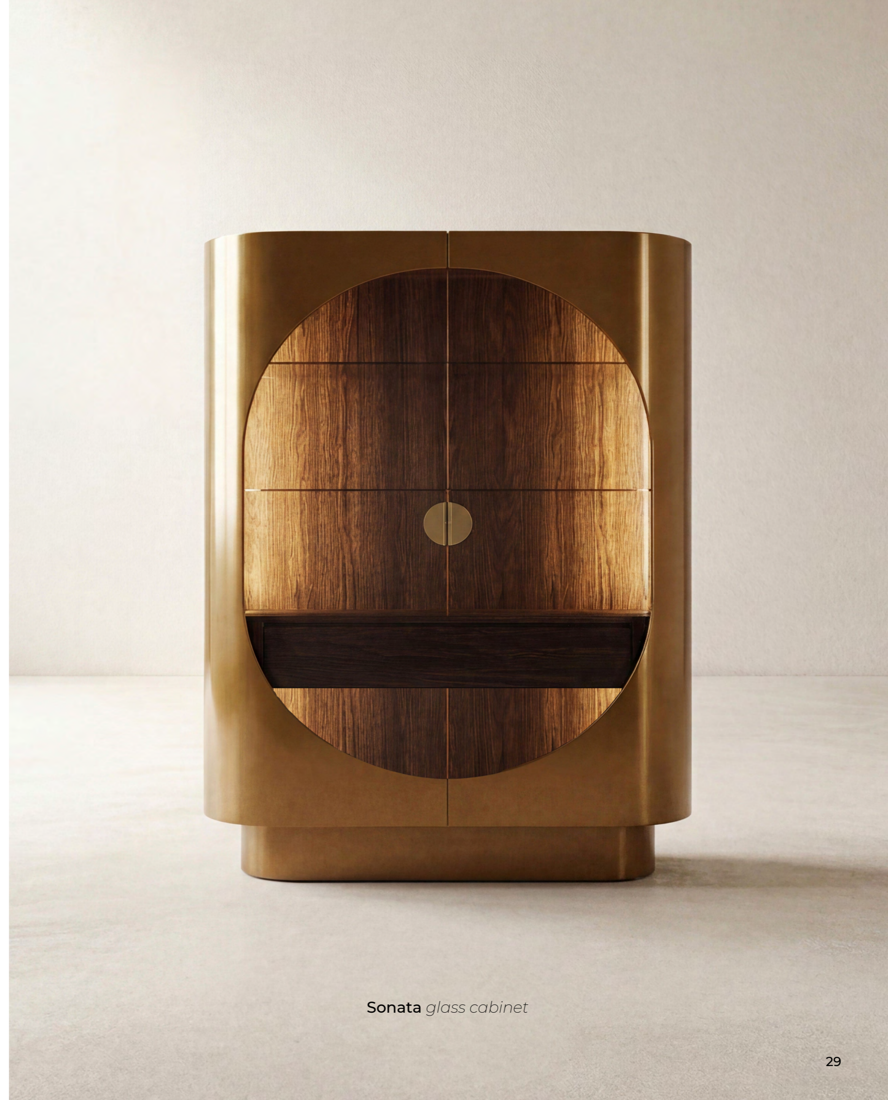
Sonata glass cabinet