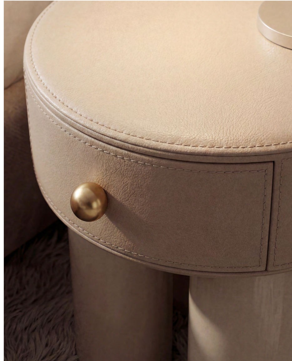
Riflesso night table