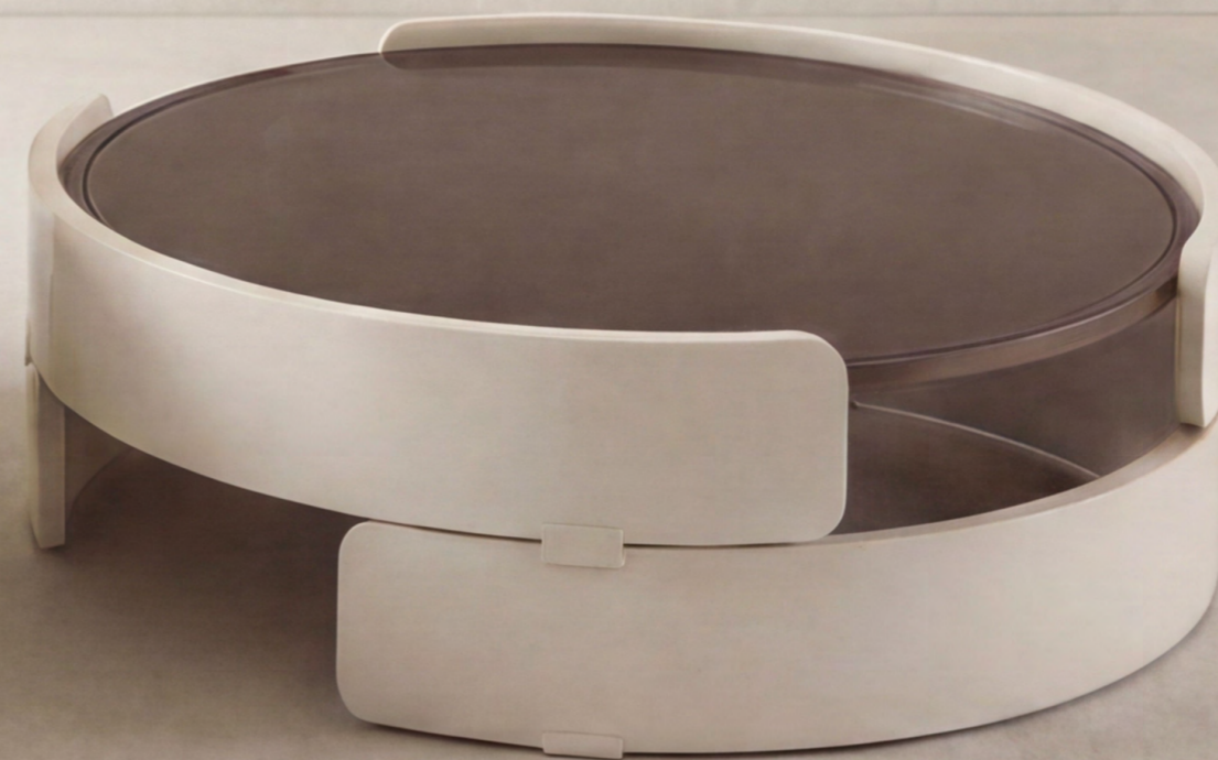
Eco coffee table