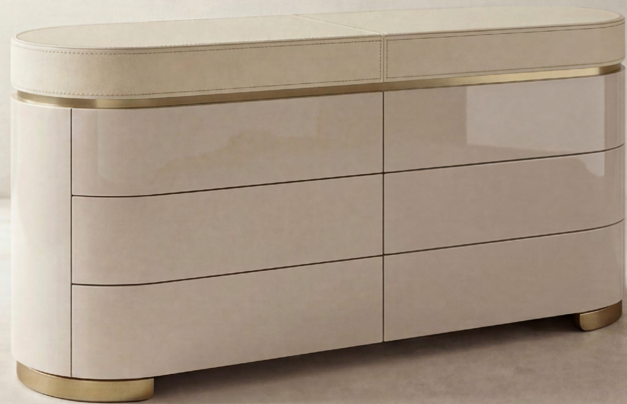
Riflesso 6 drawers dresser