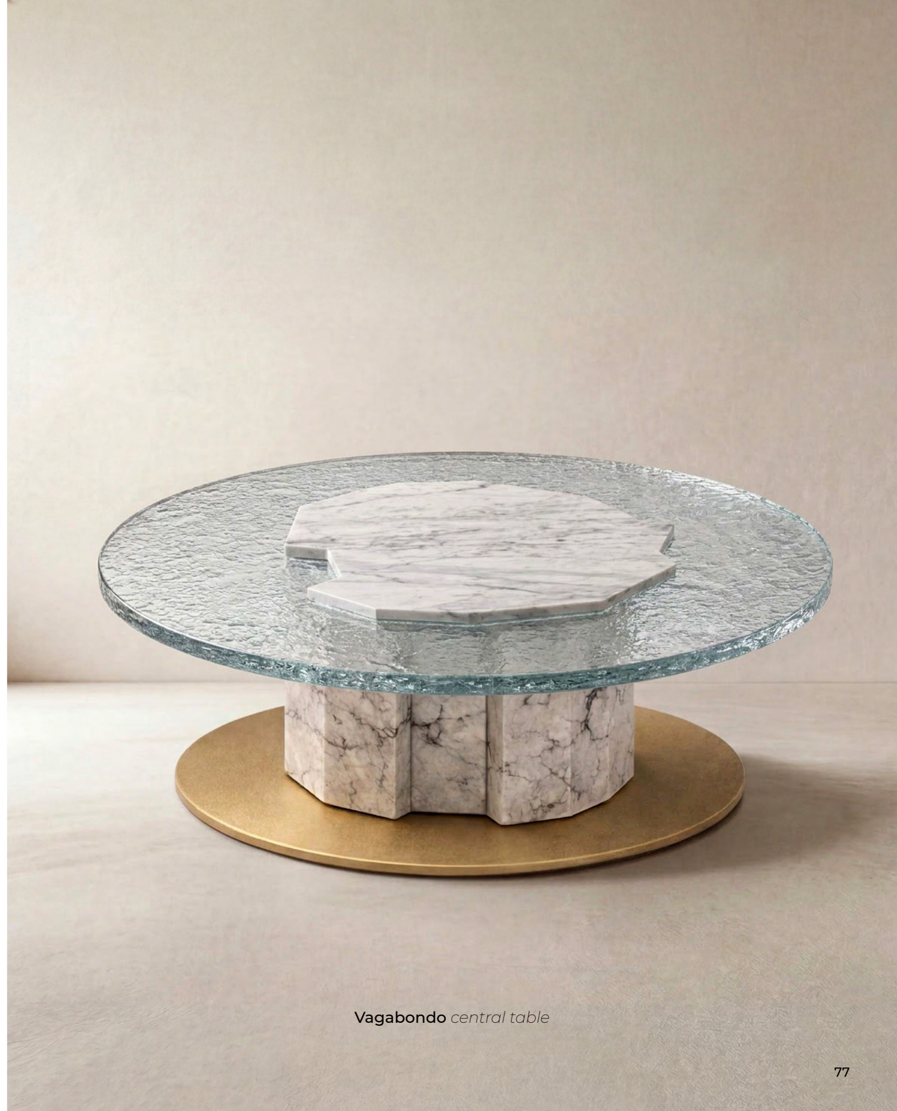
Vagabondo central table