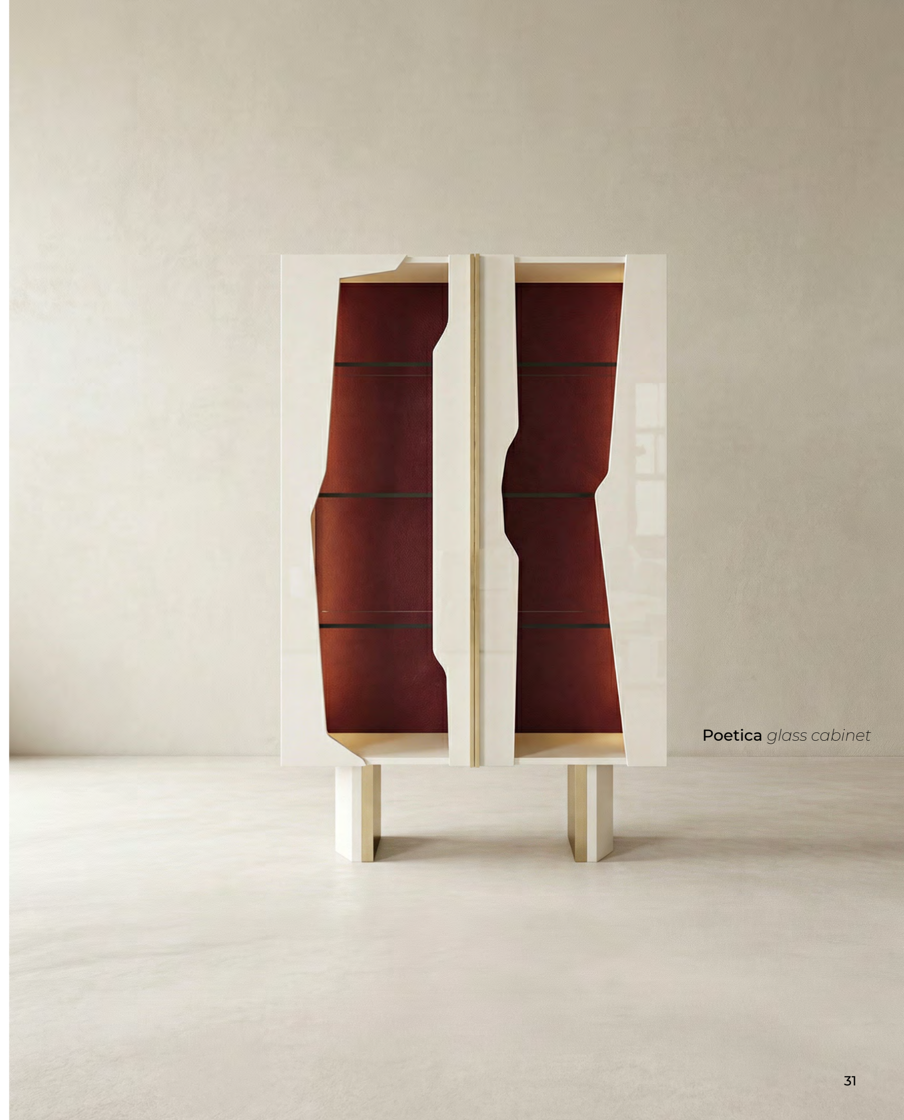
Poetica glass cabinet