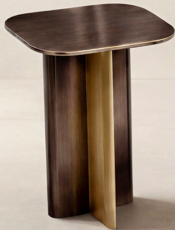
Rima side table